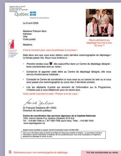
2 ans après la dernière mammographie de dépistage