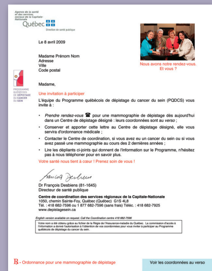
Invitation à 50 ans

Dans le cadre de la nouvelle approche auprès des femmes, les différentes lettres ont été modifiées afin d'être plus faciles à lire et invitantes.