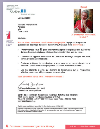
12 semaines après l'invitation si la femme n'a pas répondu