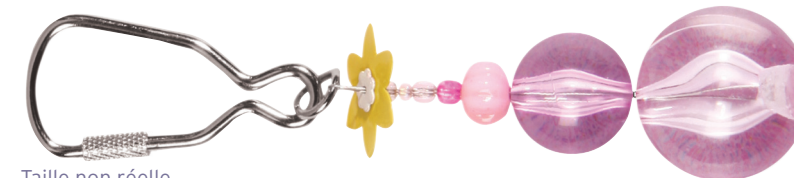
Taille non réelle

La Société canadienne du cancer a conçu un nouvel outil éducatif pour les professionnels de la santé, le Mémo-Mamo. Cet outil présente la taille moyenne de bosses ou anomalies découvertes lors de mammographies régulières, lors d'une première mammographie, à l'examen clinique des seins ou par la femme elle-même. Il vise à démontrer aux femmes, l'efficacité de la mammographie régulière (dès l'âge de 50 ans), l'anomalie étant découverte plus précocement.