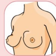
Creux (rétraction de la peau) ou voussure (bombement)